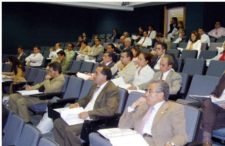
Público asistente al evento.