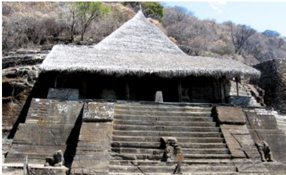
Zona Arqueológica de Malinalco.

Brindar a los profesionales de la Contaduría Pública las herramientas necesarias, para un óptimo desarrollo profesional, y actividades de integración social, ha sido una de las constantes de nuestro Colegio, y de cada una de las Vicepresidencias y Comisiones de trabajo que lo integran.