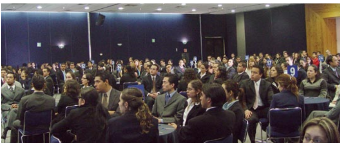
Participantes del Maratón Fiscal.

Felicitemos a todos los equipos participantes, y agradecemos especialmente a nuestro patrocinador, PricewaterhouseCoopers y a las universidades que participaron para hacer posible este evento. 🌸