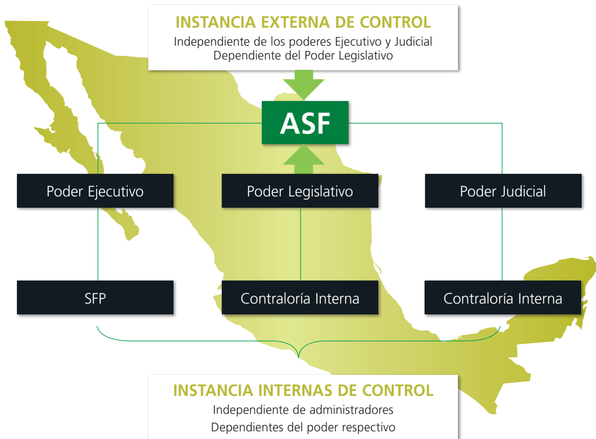
Instancias de control del Estado mexicano