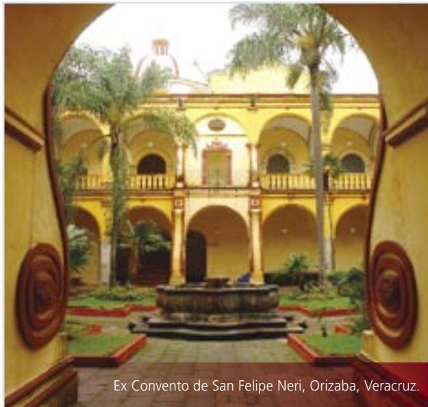
Ex Convento de San Felipe Neri, Orizaba, Veracruz.

¿Sabes qué es el turismo cultural?, ¿te gustaría emprender esta aventura? Mucha gente habla de él, pero pocos lo practican. Se conoce también como turismo responsable o geoturismo. En todo caso, nos referimos a lo mismo; y lo que lo distingue del turismo tradicional es el hecho de vivir toda una experiencia y no sólo visitar un lugar, ser un verdadero viajero y no un simple turista.