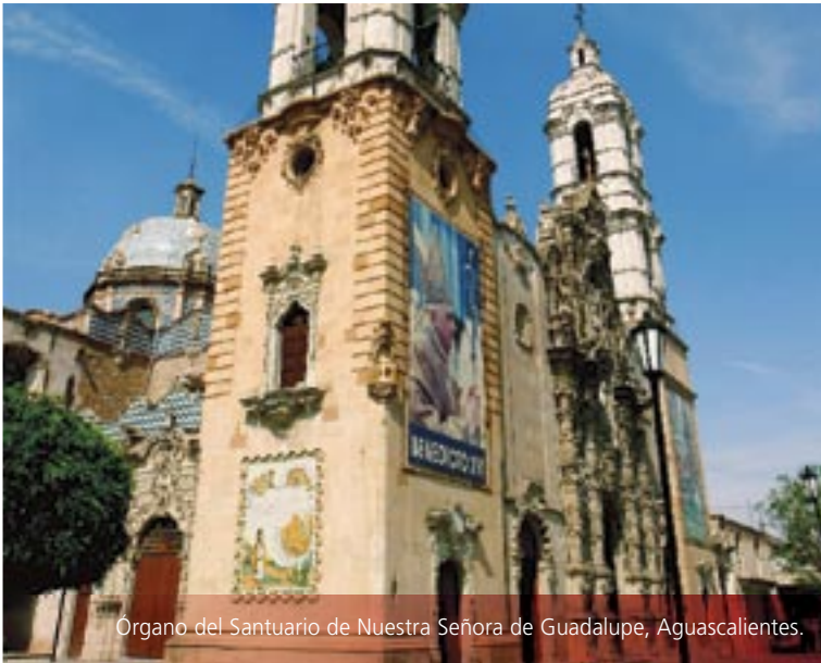
Organero del Santuario de Nuestra Señora de Guadalupe, Aguascalientes.

México ocupa el sexto lugar mundial en cuanto a número de sitios nombrados Patrimonio Cultural de la Humanidad por la UNESCO. Cuenta con 29 sitios inscritos; San Miguel de Allende es el más reciente.